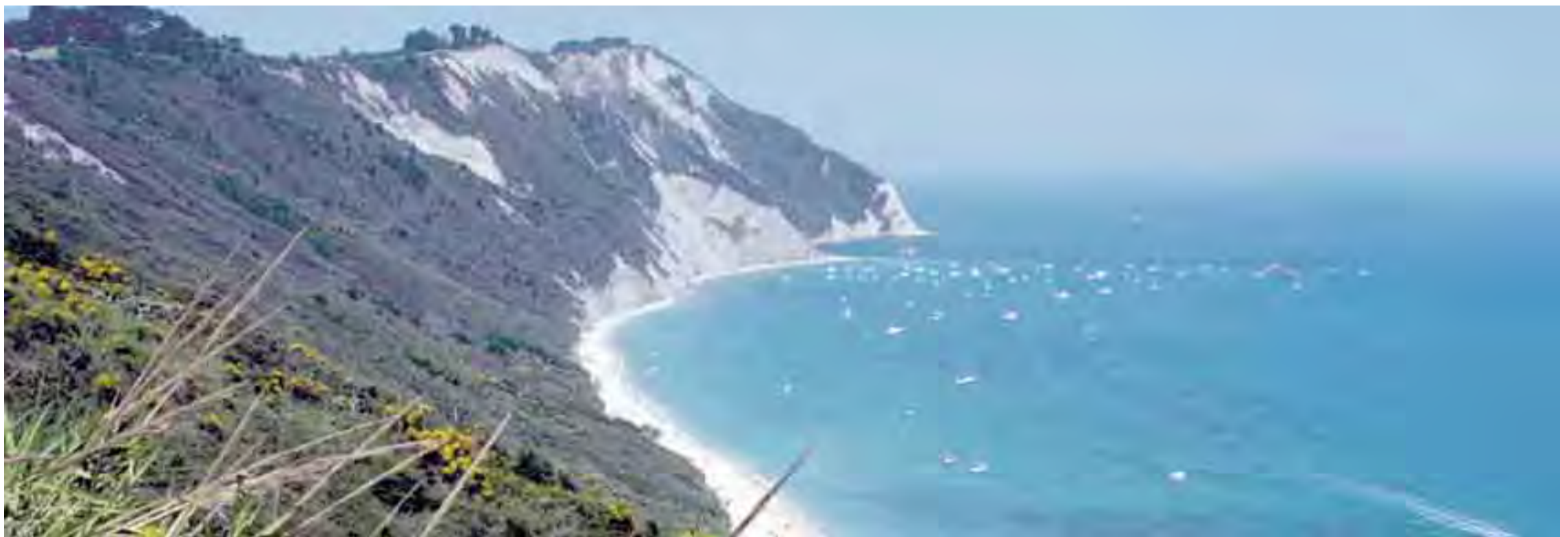
Mezzavalle è stata indicata tra le venti spiagge più ambite dal sondaggio di Legambiente e Touring Club